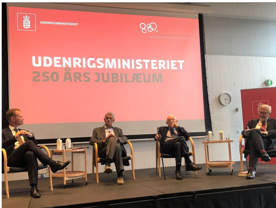
Udenrigsministeriet fejre 250 års jubilæum 2. september 2020.