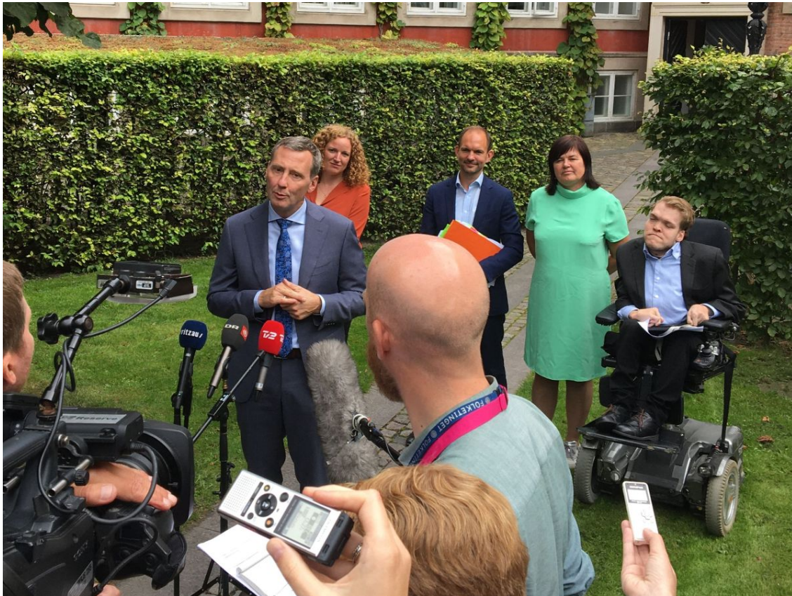
Justitsminister Nick Hækkerup præsenterer sammen med Enhedslisten, SF, Radikale Venstre og Socialdemokratiet den nye samtykkebaseret voldtægtslovgivning 1. september.