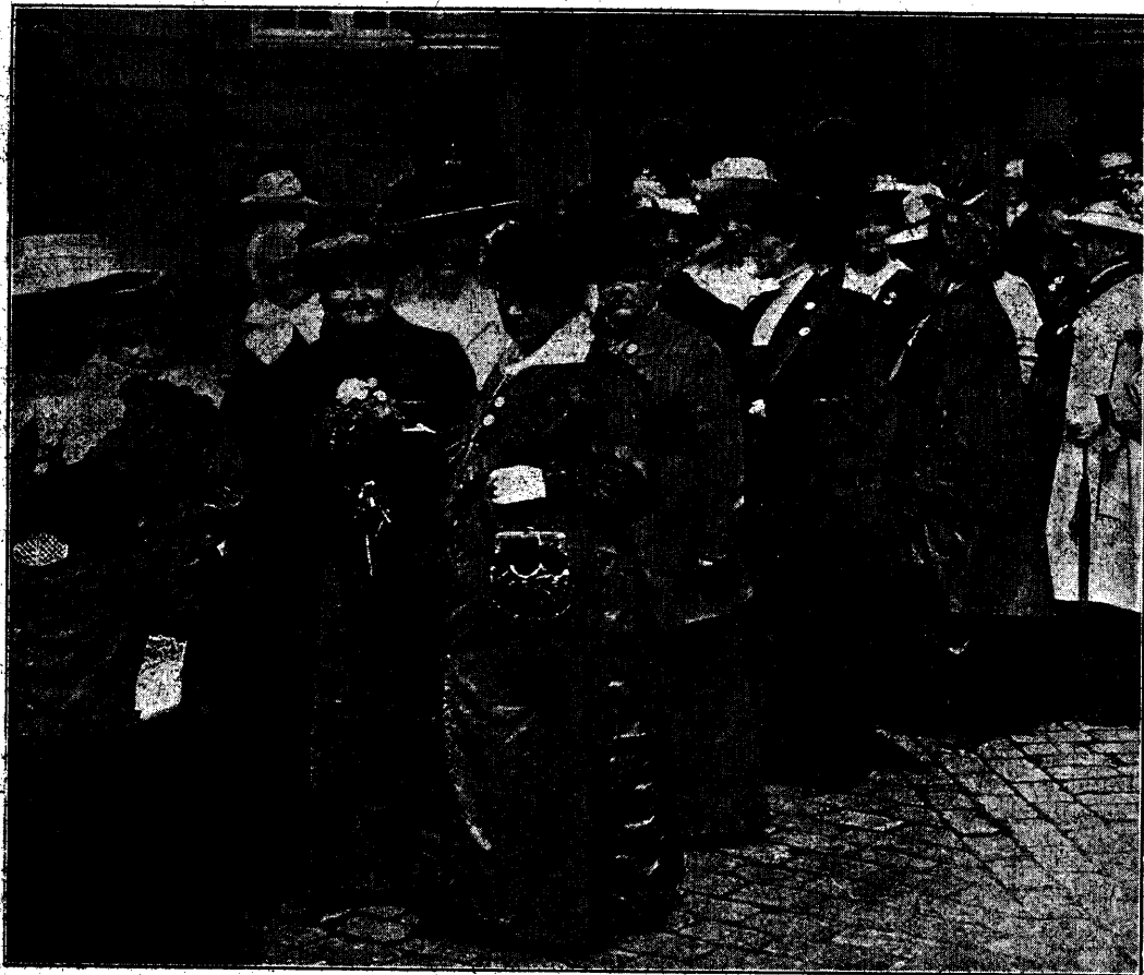
„BRUDSTYKKE“ AF DEPUTATIONEN