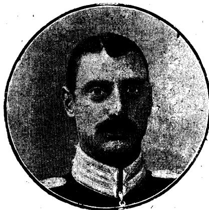
KONG CHRISTIAN d. X.

Vi Mænd haaber, at Kvindernes politiske Valgret skal faa en heldbringende Virkning paa Statsstyrelsen. Det er min Tro, at Kvinderne vil elske Freden, og at de vil fremme den sociale Lovgiv-